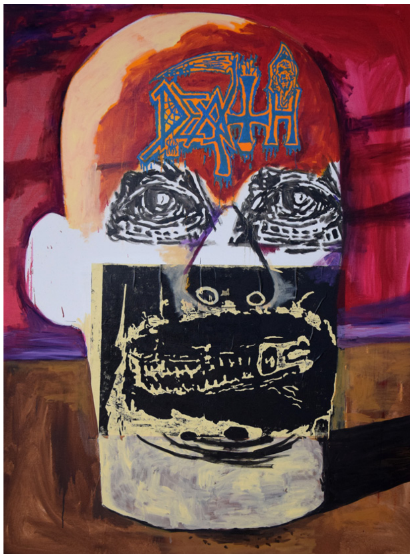
Damien Deroubaix, Painter 1 (Death) , 2018. Huile et collage sur toile, 200x150 cm. Courtesy de l'artiste © ADAGP, Paris 2018

MAMC+ SAINT-ÉTIENNE MÉTROPOLE rue Fernand Léger 42270 Saint-Priest-en-Jarez Tél. +33 (0)4 77 79 52 52 www.mamc-st-etienne.fr mamc@saint-etienne-metropole.fr