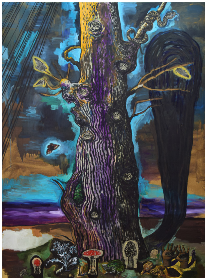
Damien Deroubaix, L'arbre , 2018.